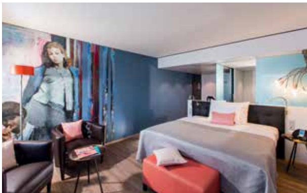
Künstler: Christoph R. Aerni (Arte Style)