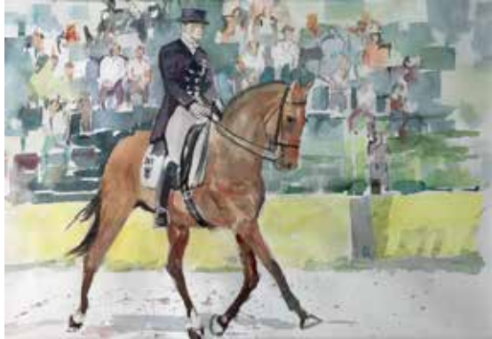
Elegante Reiterin, 2012

«Als Rentner begann ich mit dem Aquarellieren, im törichten Glauben, dies sei die einfachste malerische Technik. In der Folge besuchte ich Malwochen in der Provence und in der Toskana, um mir unter kundiger Leitung die notwendigen Grundlagen anzueignen.