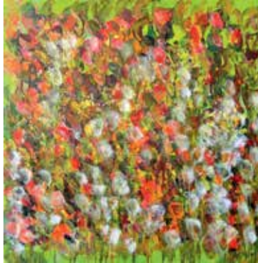
Sommer 2017, 2017