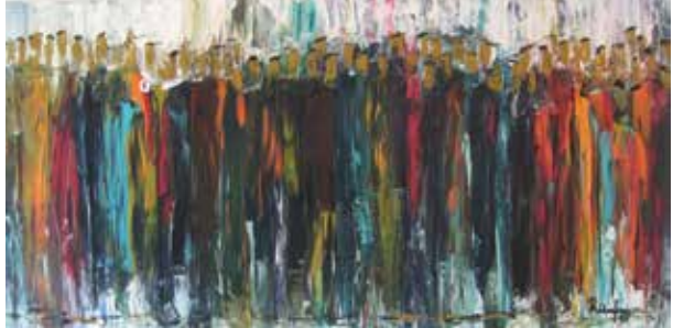
Buntes Treiben, 2017

«Bunt ist das Leben, bunt sind auch die Menschen, vielfältig, anders. Toleranz und Respekt sind Werte, die ich versuche in meinen Begegnungen mit Menschen zu leben.»