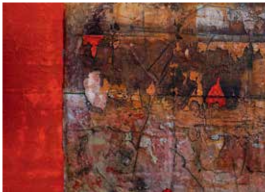
Ohne Titel, 2017

«Meine künstlerische Tätigkeit bedeutet mir alles. Ich arbeite beim Malen und Gestalten in den unterschiedlichsten Techniken. Wenn ich mit dem Malen eines Bildes beginne, habe ich vorerst keine genaue Vorstellung. Ich beginne, beobachte, frage das Bild, wie es weitergehen soll, es ist dies ein Dialog, der viel Spontanes in sich trägt.