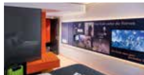
Künstler: Franz Hohler (Comfort Style)