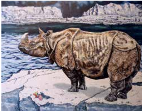
Le changement, 2015