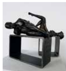
Legend, 2011 (vorne) Entspannt, 2011 (hinten)

«Den Zugang zur Kunst und zur Malerei fand ich erst im Erwachsenenalter. Eine Auszeit gab mir den Raum und die Musse, diese besondere Begabung neu zu entdecken. Als Autodidakt liess ich mich voll und ganz darauf ein und lote dieses Experimentierfeld aus. Dabei entwickelte ich bald eine eigenständige Bildsprache. Das aus eigenen Erfahrungen gemachte Wissen ergänzte ich bei verschiedenen Künstlern und mit Kursen an der Schule für Gestaltung in Zürich. Die Freude und Neugier, Neues zu entdecken und zu erfahren sowie die Möglichkeit, mich mit verschiedenen Medien und Materialien ausdrücken zu können, hat mich dazu bewogen, mich vollständig in der Gestaltung zu betätigen. Mit verschiedenen Weiterbildungen im gestalterischen Bereich bin ich heute freischaffend als Künstlerin sowie auch in pädagogischen Bereichen tätig. Seit über fünfzehn Jahren realisiere ich regelmässig Ausstellungen mit Bildern sowie Skulpturen und Objekten.»