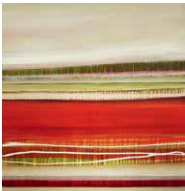
Horizont, Nr. 4-2016