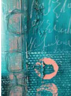
Ohne Titel, 2017